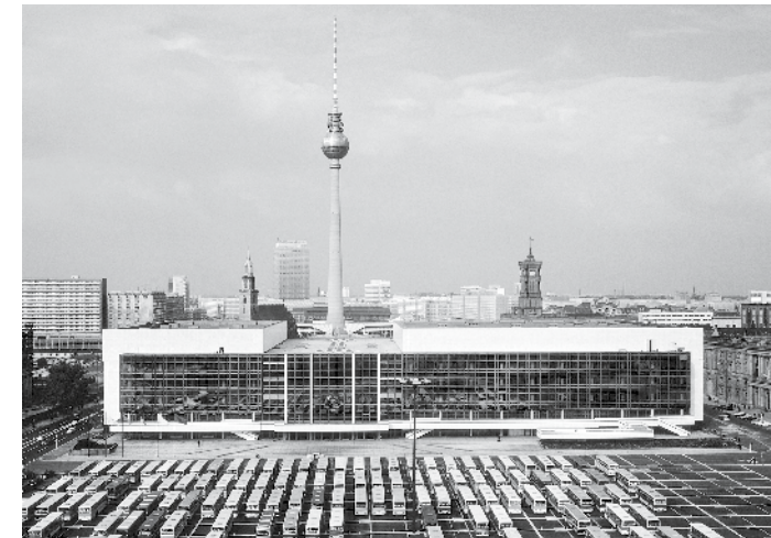
Palast der Republik, Berlin-Mitte, 1972–1976, Architekten: Heinz Graffunder mit Karl-Ernst Swora | Wolf R. Eisentraut | Günter Kunert | Manfred Prasser | Heinz Aust

Ausstellungsgestaltung | www.dialog-hamburg.de