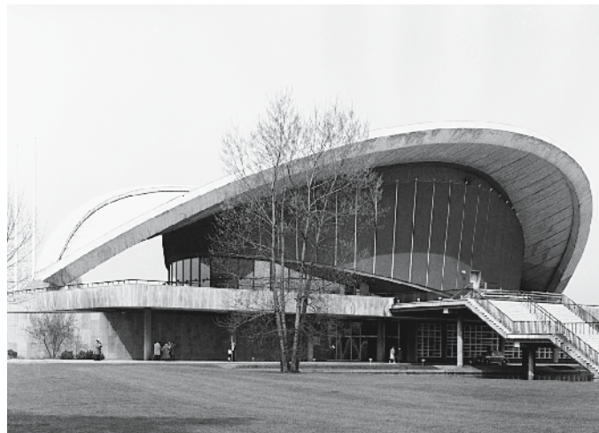
Kongresshalle, Berlin-Tiergarten, 1957, Architekt: Hugh Stubbins

Den Diskursen sind gebaute Architekturen gegenübergestellt, von denen etwa ein Drittel aus der ehemaligen DDR und zwei Drittel aus der vormaligen Bundesrepublik stammen. Diese exemplarischen Bauaufgaben, für z.B. Schulen, Wohngebäude, Kirchen und Synagogen, Theater, Industrieanlagen, Sporteinrichtungen sind in den Themengruppen Staat, Kultur und Glauben, Wohnen und Freizeit, Bildung und Ausbildung, sowie Wirtschaft und Verkehr dargestellt. Innerhalb der Bauaufgaben sind die ausgewählten Architekturbeispiele zwar zeitlich, nicht aber nach Ost und West geordnet. So bleibt es dem Besucher überlassen, anhand der Legenden eine politisch-geographische Zuordnung vorzunehmen.